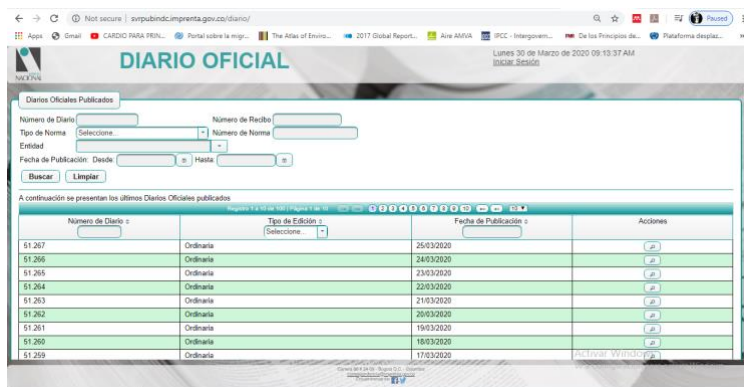
Imagen 1. Página web del Diario Oficial. Fecha: 30 de marzo de 2020 4