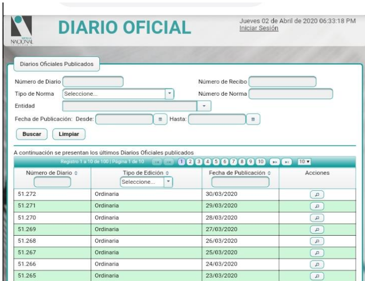
Imagen 4. Página web del Diario Oficial. Fecha: 3 de abril